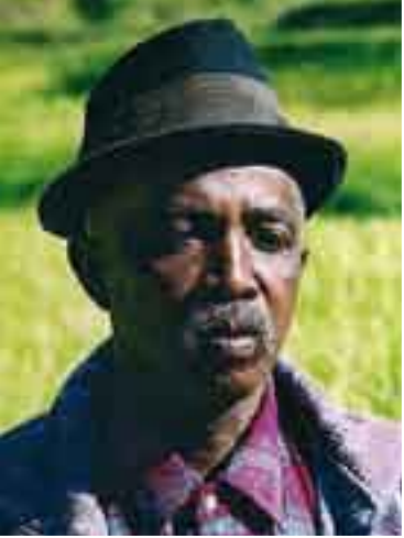
RANOELY - Ce semencier... This seed producer...