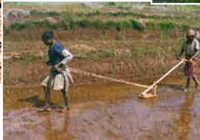
Bladed hoe for teaching SRI--the SRI-05, created in 2005.

Sarcleuse SRI - 05 scolaire (création 2005)