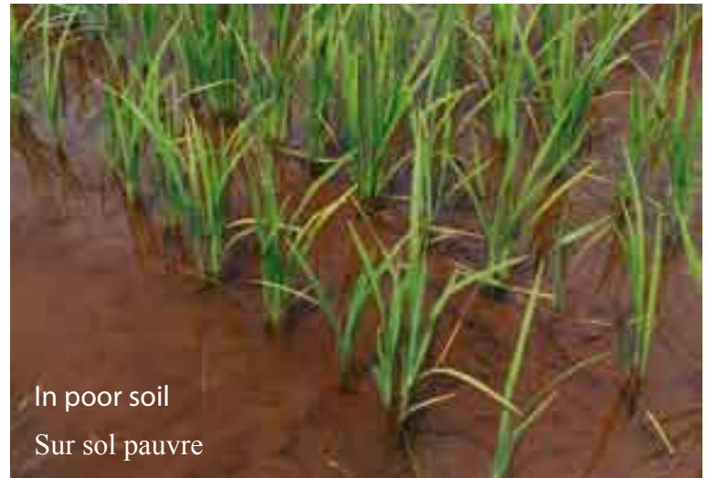
In poor soil Sur sol pauvre

Ces dispositions ne réclament l'emploi que des 2 sarcleuses existantes (17 cm ou 25 cm).