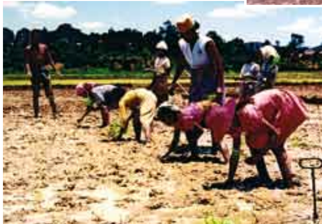
Malgaches à part entière aujourd'hui !