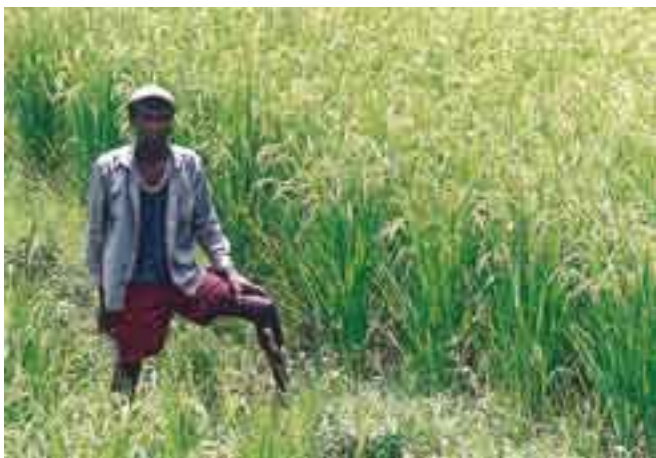
RA-JEAN (Ambosibory - Befeta)