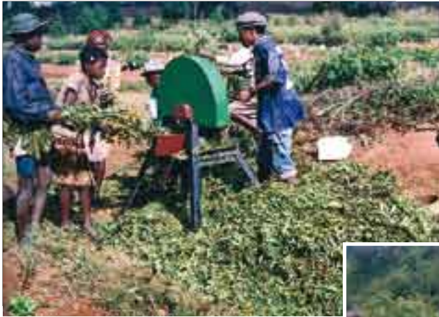
New equipment for teaching SRI in schools