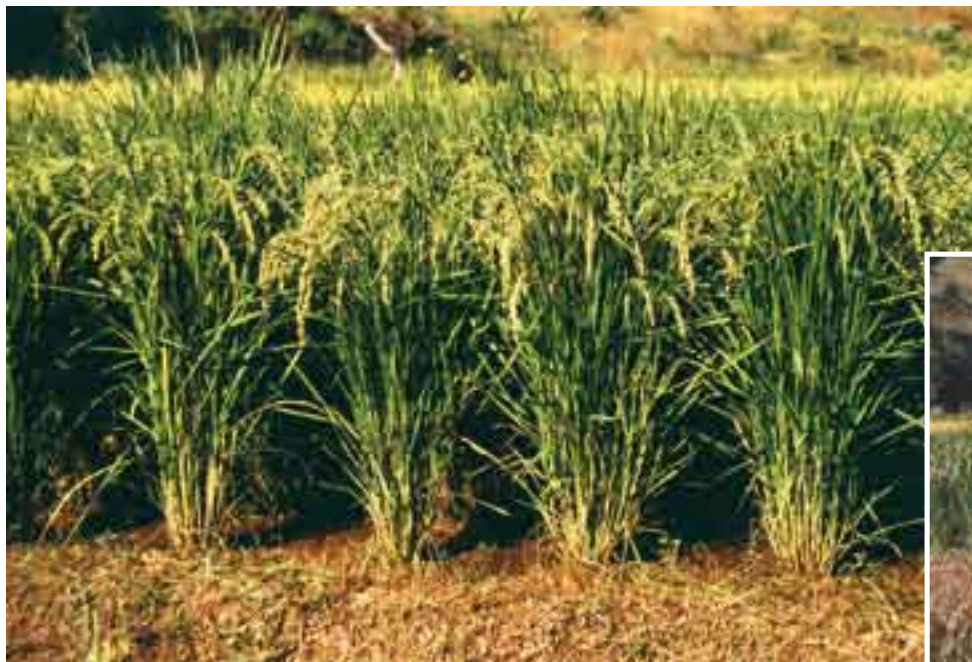
... assure la pérennité de semences malgaches.