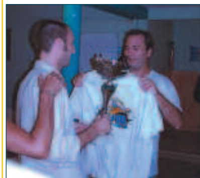
Un joueur des "magnégnés" reçoit la coupe du vainqueur.

Ce samedi avait lieu le second tournoi de water-polo organisé par l'associa-