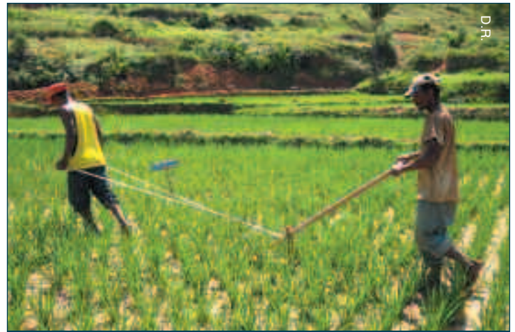
Des riziculteurs utilisant le SRI à Madagascar.

Le SRI, qui permet à la fois de préserver l’environnement et de développer l’économie devrait se répandre comme une traînée de poudre. Trente-deux pays l’utilisent déjà, dont les principaux producteurs mondiaux. Pourquoi peine-t-il tant à se développer à Madagascar ? “Il y a plusieurs raisons”, explique Frédéric Guérin. “Lorsqu’on explique aux paysans qu’ils peuvent multiplier leurs